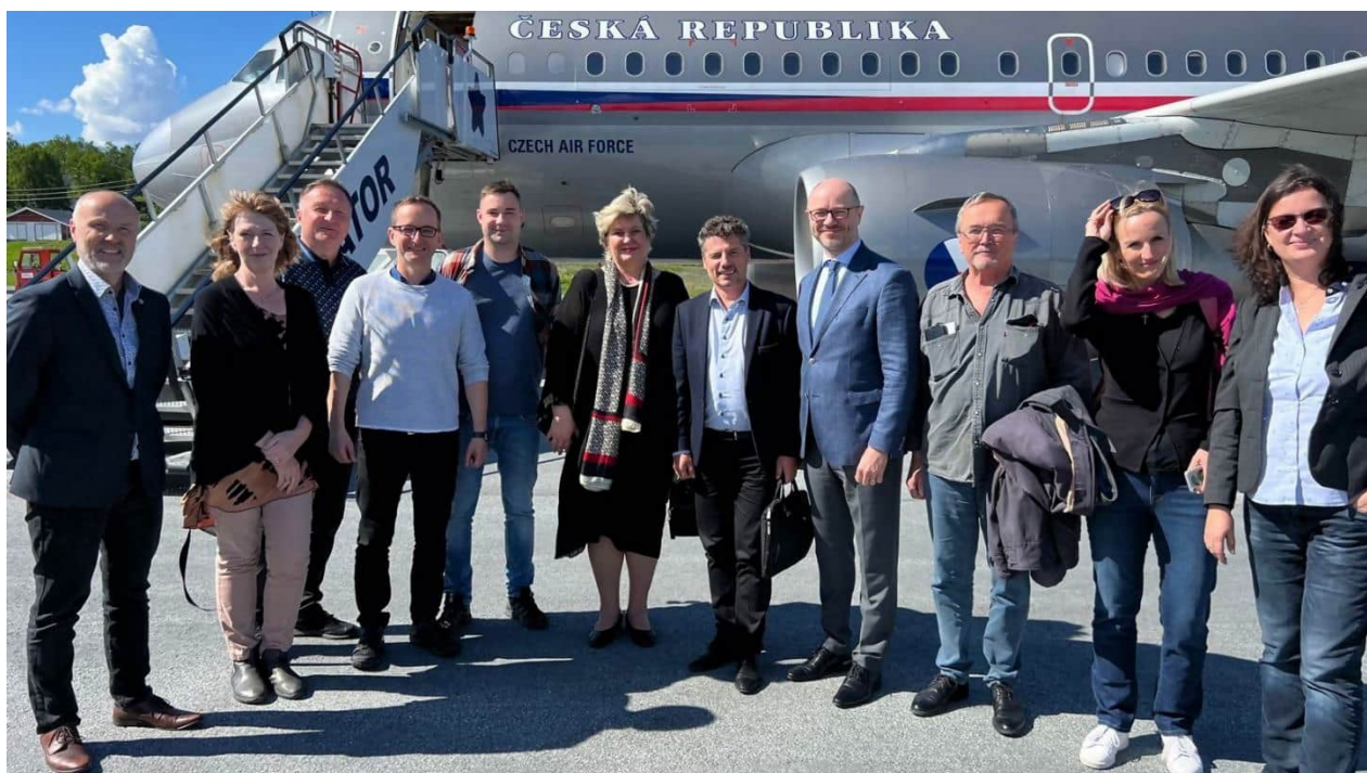
Vládní speciál s poslaneckou delegací v doprovodu Jihočeské univerzity, Tromsø.