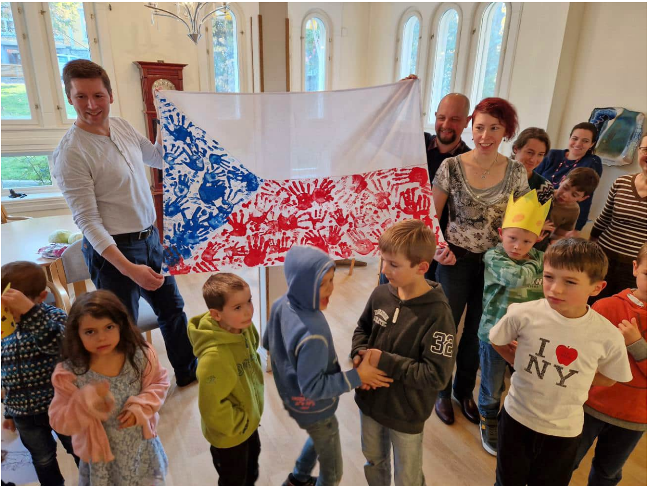
V neděli 13. října pořádalo Česko-norské fórum lehce opožděnou oslavu sv. Václava.