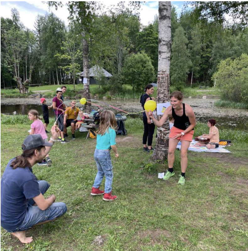
Děti měly možnost zapojit se do různých soutěží a aktivit.