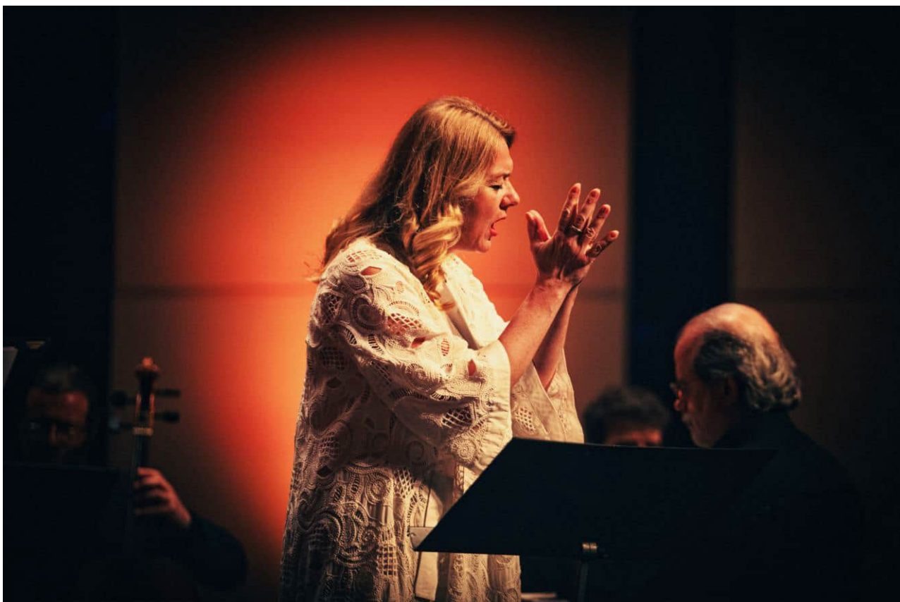
Magdalena Kožená s barokním orchestrem La Cetra ve Velkém sále Bærum Kulturhus.