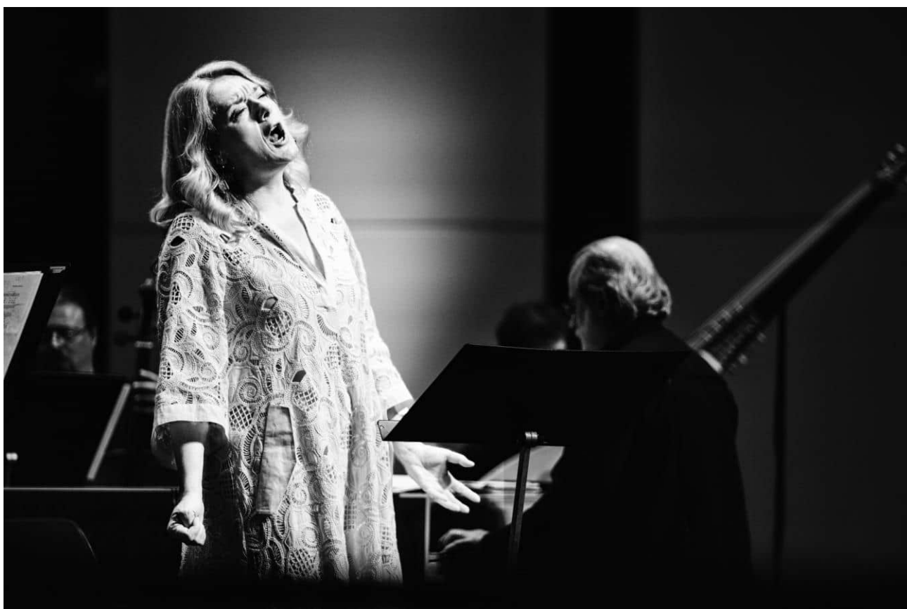
Magdalena Kožená s barokním orchestrem La Cetra ve Velkém sále Bærum Kulturhus.