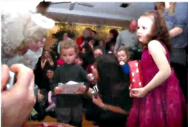
Postupně se děti osmělily a Mikulášovi zazpívaly písničku nebo odříkaly básničku.