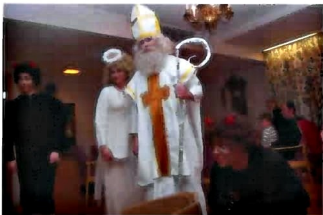
Tajil se dech, když Mikuláš, Anděl a hned dva čertíci vstoupili do místnosti