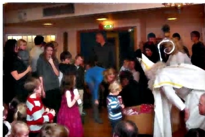
Kdepak, nezlobily, a zaslouží si mikulášskou nadílku

Všechny děti si nadšeně odnášely nadílku. A zatímco prozkoumávaly její obsah, losovala se bohatá tombola.