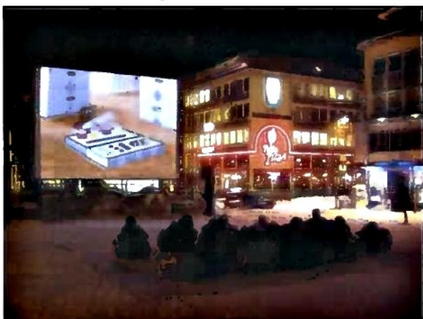
Promítání epizod Krtečka ve venkovním kine v centru Tromso

První kulturní akcí s logem českého předsednictví v Radě EU, která se v Norsku uskutečnila, bylo promítání třinácti českých