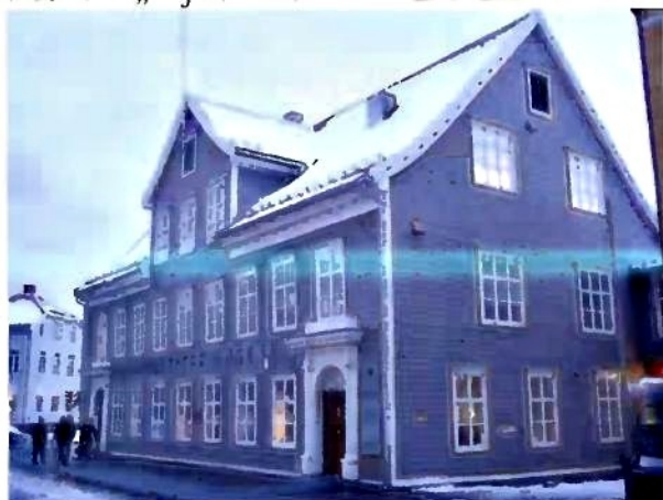
Perspektivet Museum, zde proběhla cise vina poradana cs. ambasadou

Ohlas měla i projekce epizod kresleného Krčka a seriálu „A je to“ ve venkovním kině.