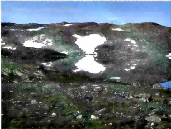
Volvavatnet, jezero ve Skarvheimu

pouští si k tomu norské lidové zvuky. Pak jsme se ještě povozili lodí po fjordu a vystoupili jsme v Aurlandu.